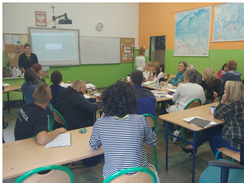
Nauczyciele przez wiele dni szkolili się pod okiem wykwalifikowanych trenerów.