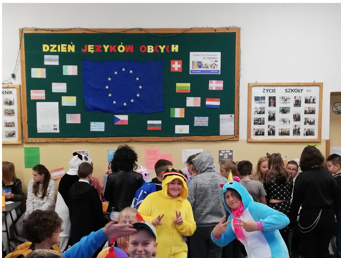
Korytarz na I piętrze był tego dnia kolorowy, rozbawiony!