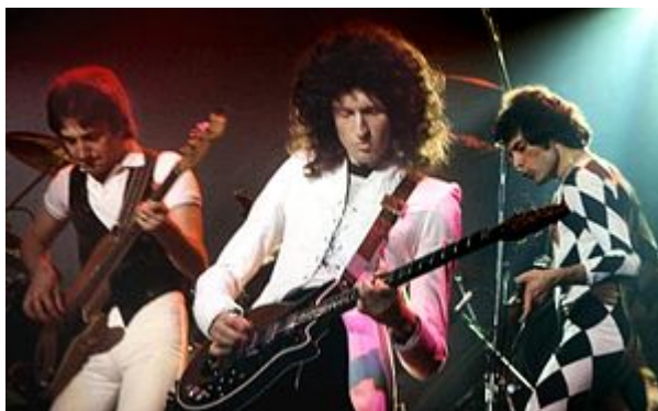
Queen podczas koncertu w 1977. Od lewej: Deacon, May, Mercury