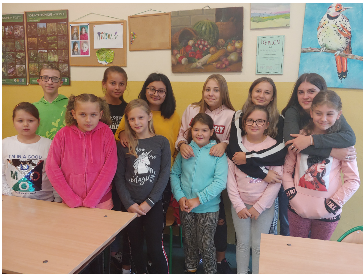
Nowa szkolna rodzina- starsze i młodsze "rodzeństwo".