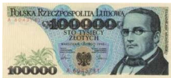
Stanisław Moniuszko na polskim banknocie 100000 zł.