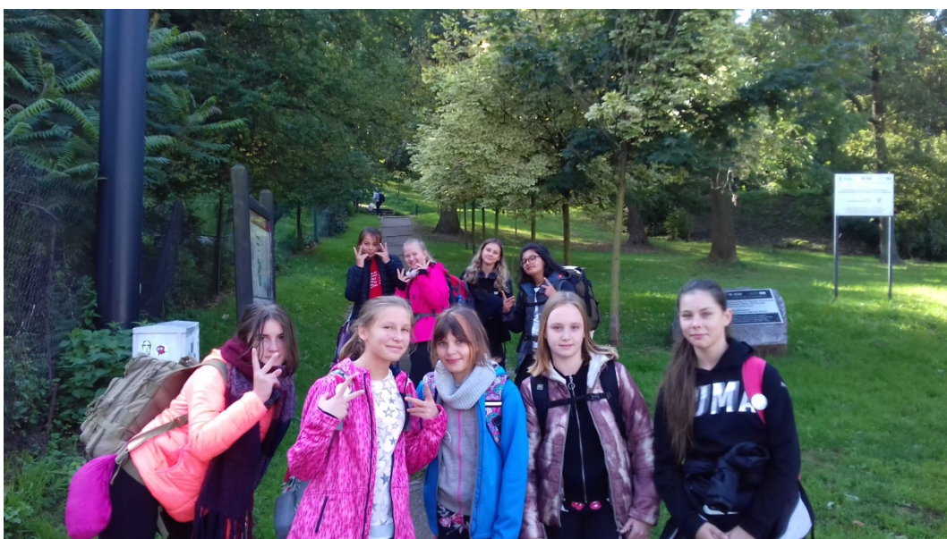
Dziewczęta w wyśmienitych humorach.