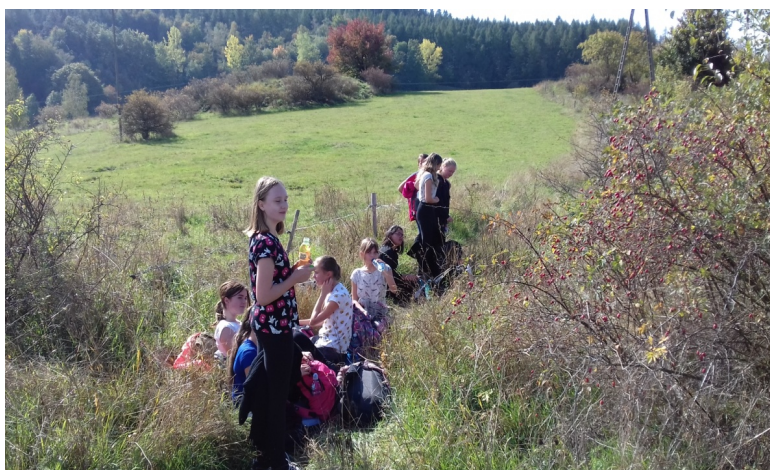
Jeden z postojów na trasie w „szczerym polu” za Kamienna Górą”.

Drugiego dnia nasza trasa wiodła ze Schroniska, w którym nocowaliśmy, przez Dolinę Srebrnika- drogą graniczną Grzbietu Lasockiego- Przeł. Okraj (1046m. npm.)