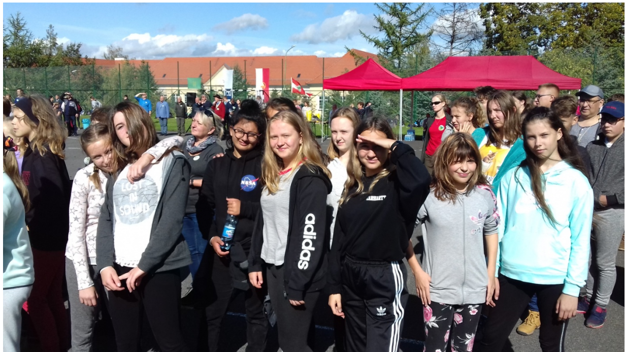
Na mecie 45. Rajdu Młodzieży Szkolnej „Kowary 2019”