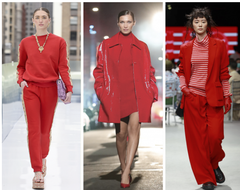
The Truth, Michael Kors Collection, UUIIN

Jesień bez koloru czerwonego to jak lato bez słońca. Dlatego dedykowany jest osobom silnym i przebojowym. Czerwień pojawia się w kolekcjach takich domów mody jak : Burberry, Dior, Michael Kors, Hermes czy Isabel Marant. Czerwień wpasowujemy w stylizację wszędzie, gdzie się da. Nosimy ją jako dres, sukienkę, płaszcz czy garnitur.