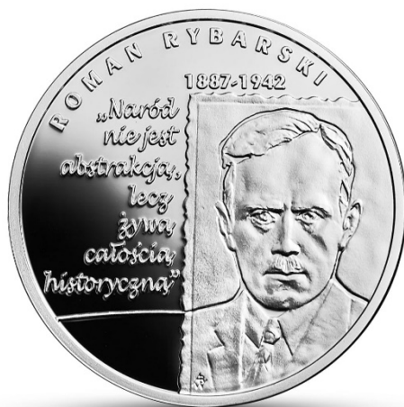
Moneta kolekcjonerska 10 zł z serii „Wielcy polscy ekonomiści”