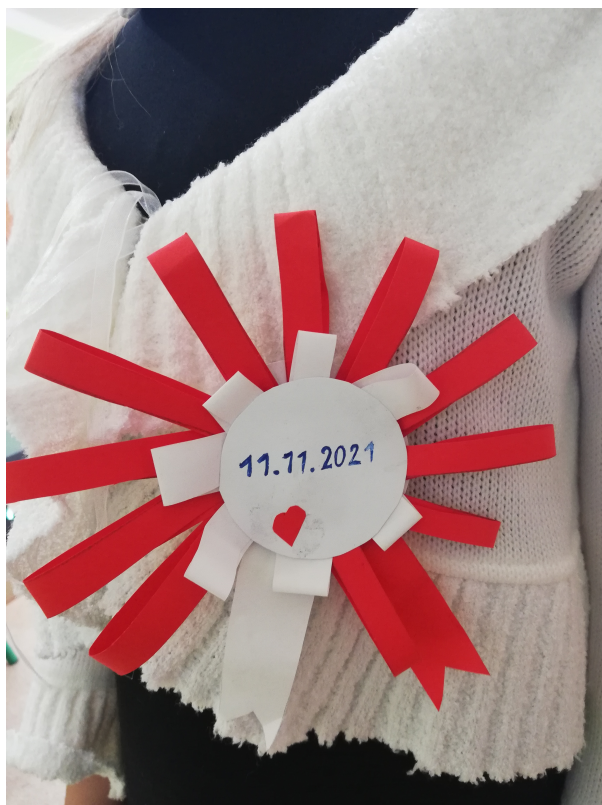
Własnoręcznie zrobione biało- czerwone kotyliony stały się ważnym dodatkiem do stroju galowego.