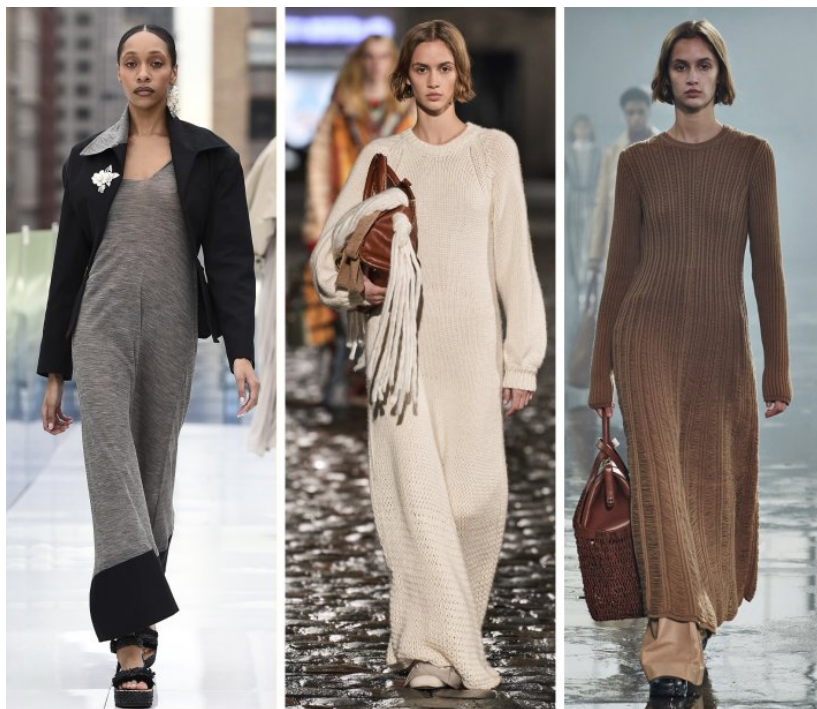
Anine Bing, Chloe, Garbiela Hearst

Sukienki z dzianiny lub komplety dzianinowe w odcieniach beżu, brązu czy szarości to bardzo modny trend sezonu jesień-zima. Proponują je domy mody: Fendi, Miu Miu czy Chloe. Sprawiają, że otuleni jesteśmy wygodą połączoną ze szykiem.