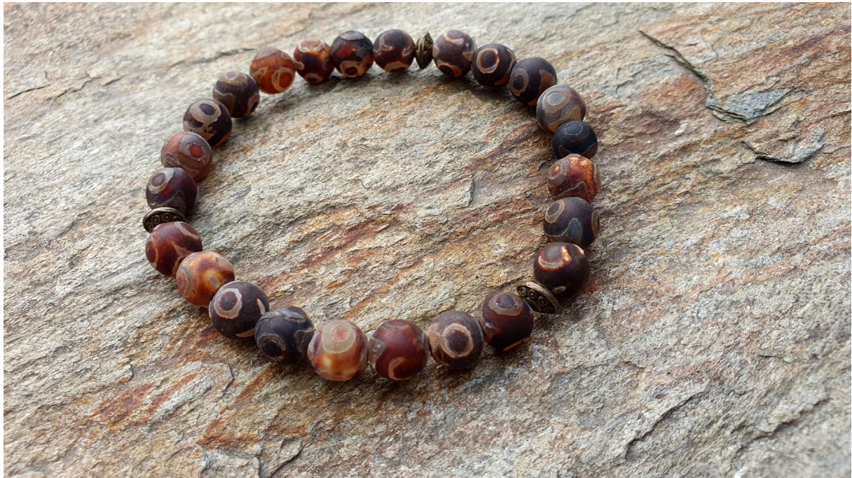
Z agatów wyrabia się piękną biżuterię.