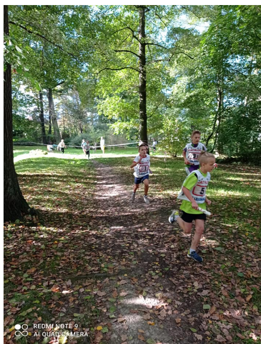
Rywalizacja była zacięta.