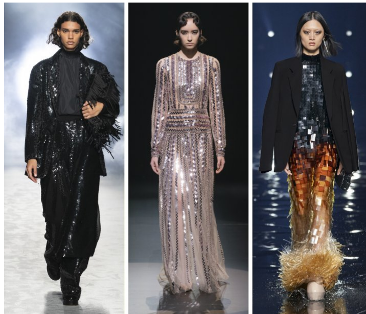
Alberta Ferretti, Valentino, Givenchy

Cekiny, błyszczące tkaniny, pióra – wszystko to, co doda polotu, ekstrawagancji i niepowtarzalnego akcentu stylizacji. Nie muszą to być całe kreacje w stylu „blink-blink”, czyli migotać i świecić. Wystarczy piękna broszka czy apaszka z błyszczącą nitką. Mody domu Alberta Ferretti, Valentino, Givenchy dedykują kreacje właśnie w stylu wieczorowym.