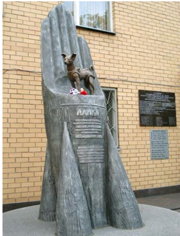
Łajka doczekała się swojego pomnika.