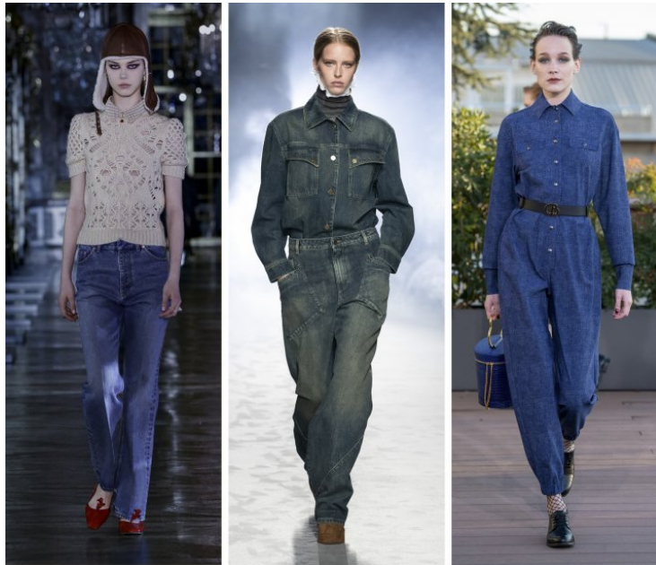
Dior, Alberta Ferretti, Chiara Boni