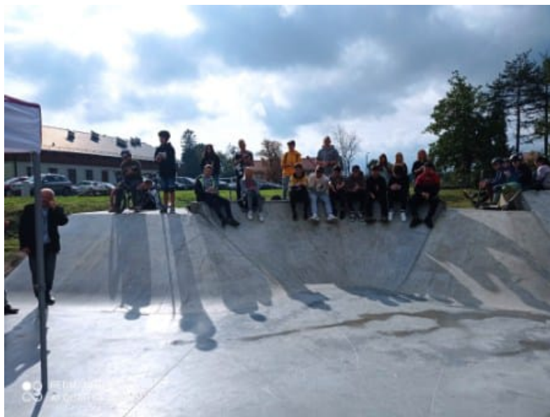
Nasi uczniowie na długo wyczekiwany skateparku.