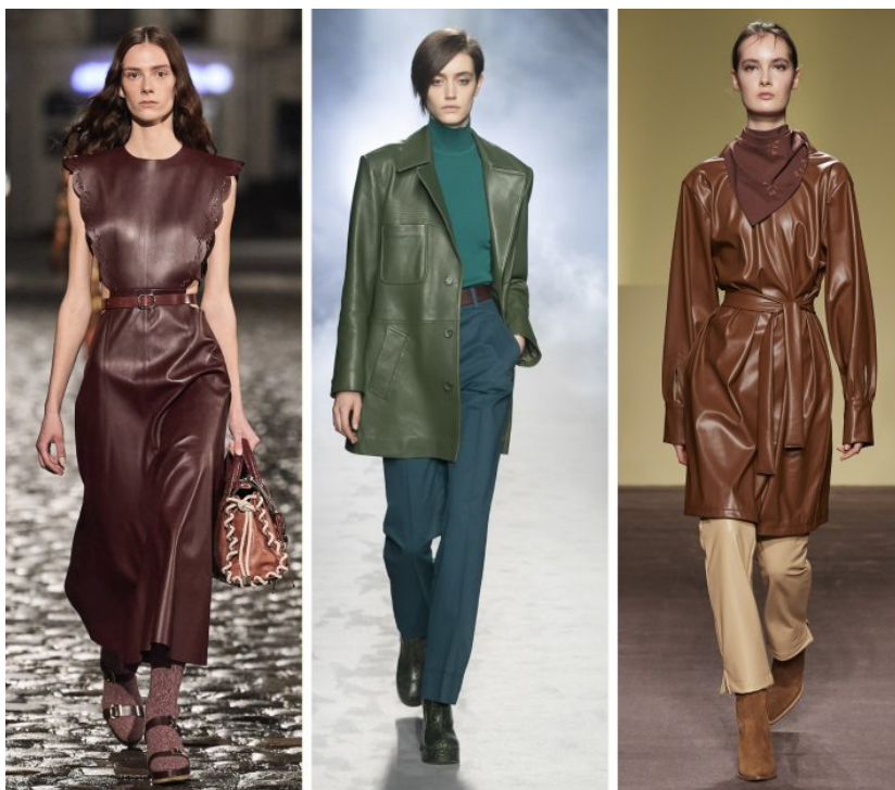
Chloe, Alberta Ferretti, Zia Budapest

Trend na skórzane ubrania powraca w sezonie jesień-zima 2021/22 z jeszcze większą siłą. Ubrania ze skóry są w klasycznej czarnej lub brązowej wersji, a także w kolorze głębokiej butelkowej zieleni. Projektanci jak Chloe, Alberta Ferretti, Zia Budapest wcieliili je w swoje kolekcje z wielkim powodzeniem.