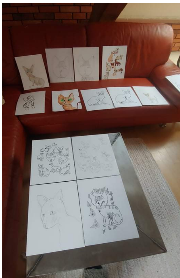
Przygotowania do Przeglądu Talentów rozpoczęły się już w domu.