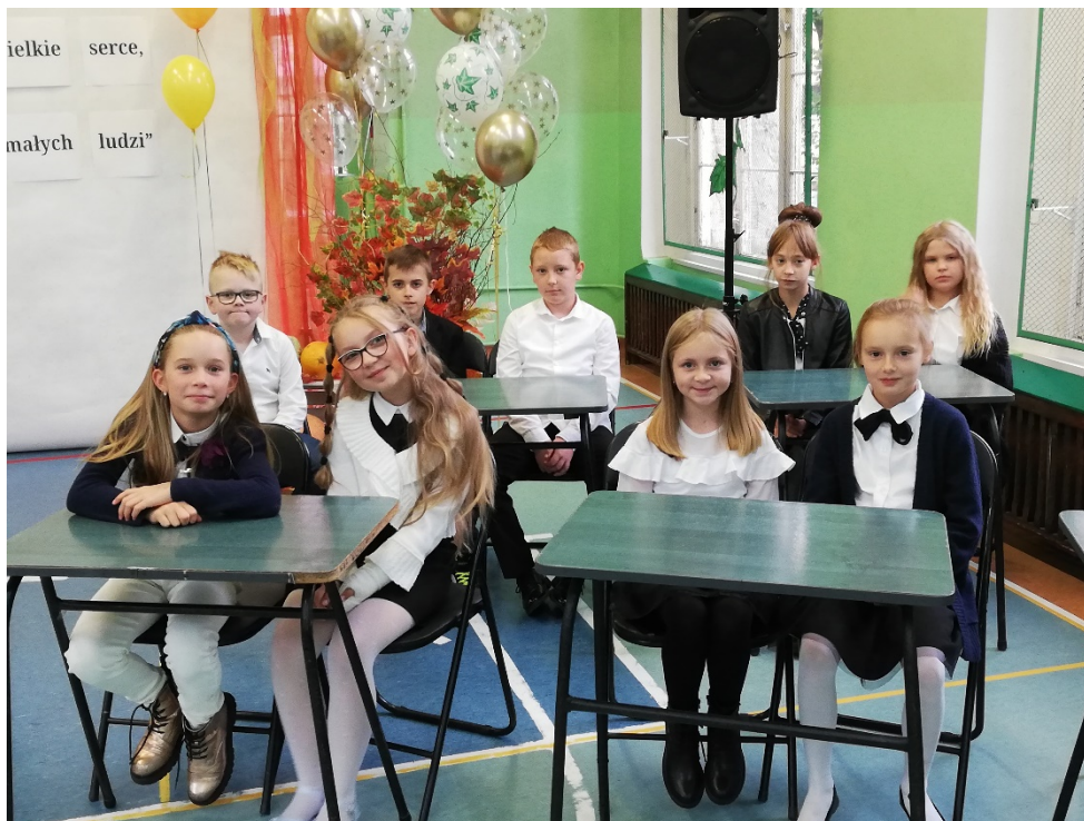
Śpiewająca klasa uczniów 4a i 4b.