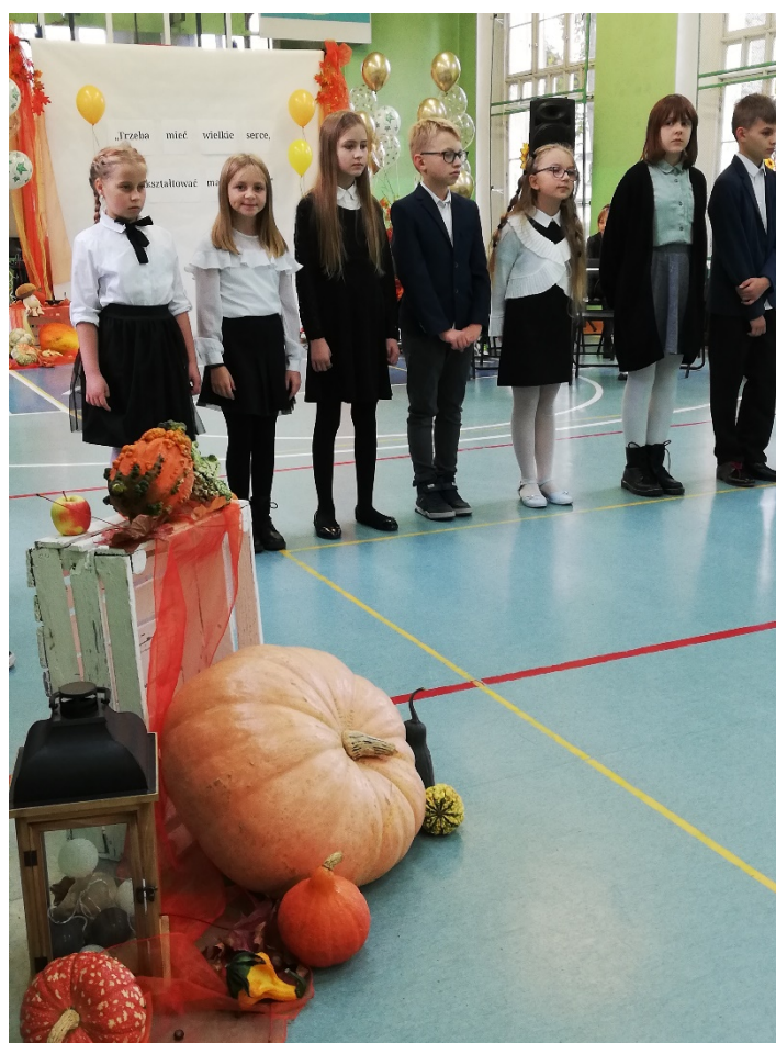
Recytatorzy przygotowali wierszowane podziękowania dla nauczycieli.