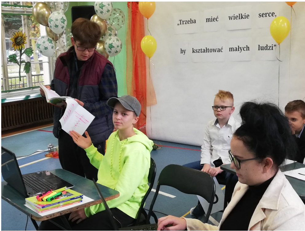
Zdalna lekcja przygotowana przez szkolny kabaret.