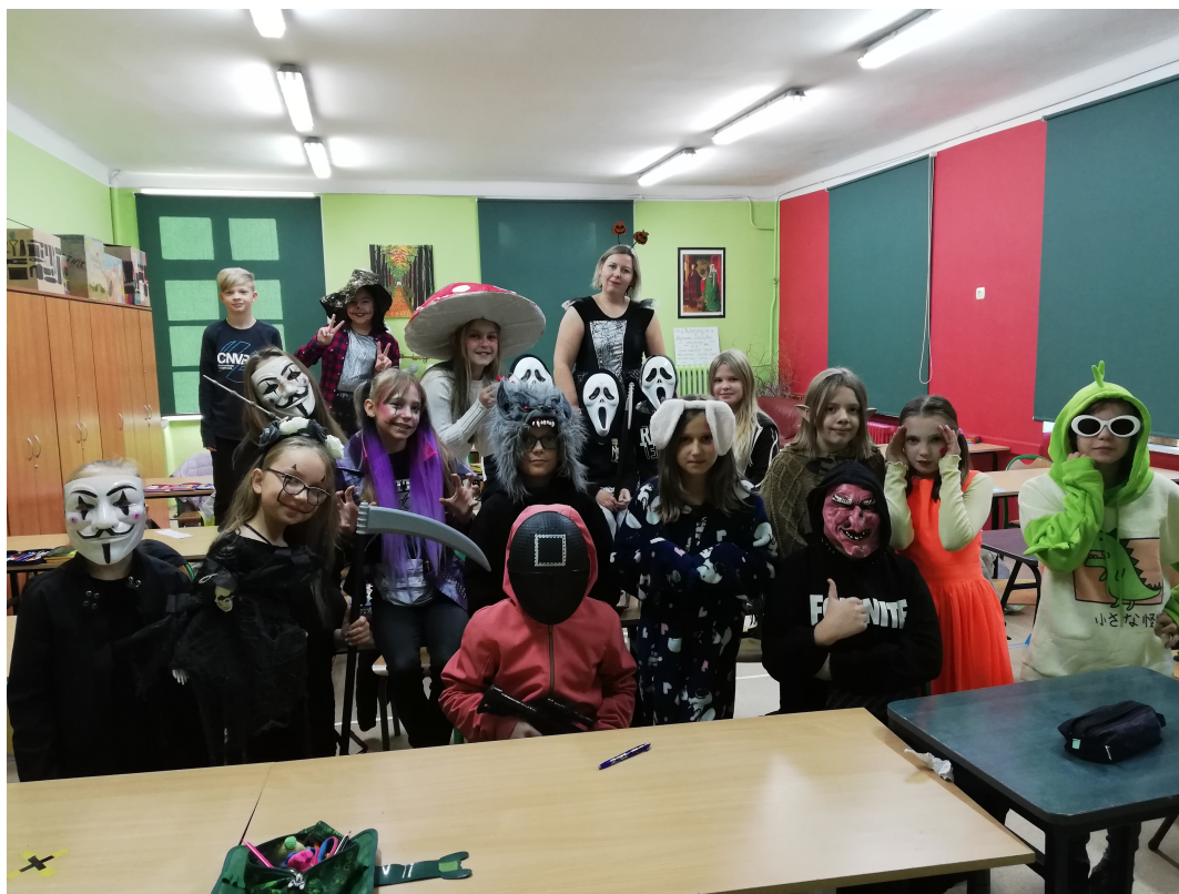
Klasa 4b z wychowawcą.