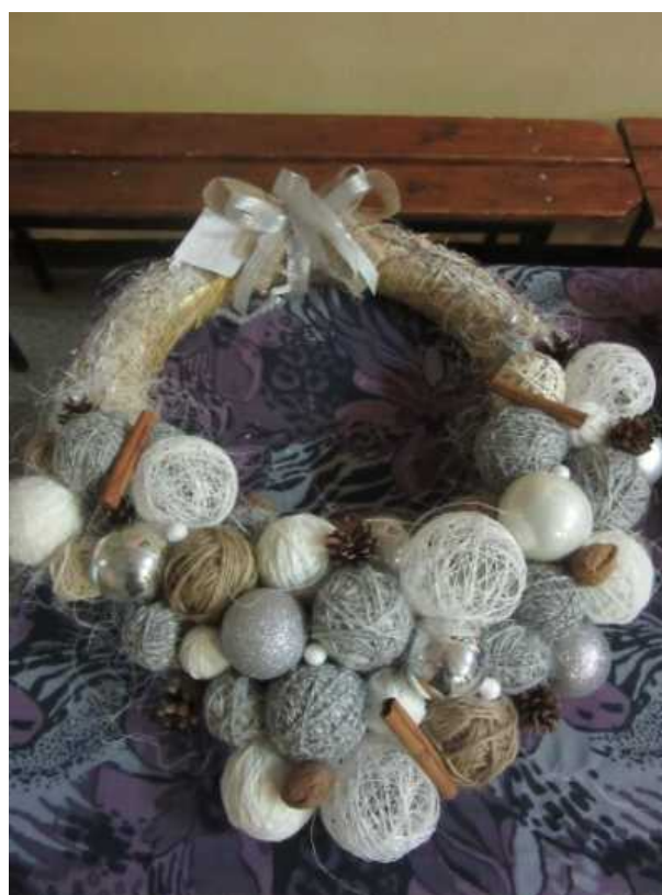
Wieniec Wiktorii Wierczek- I miejsce w gimnazjum