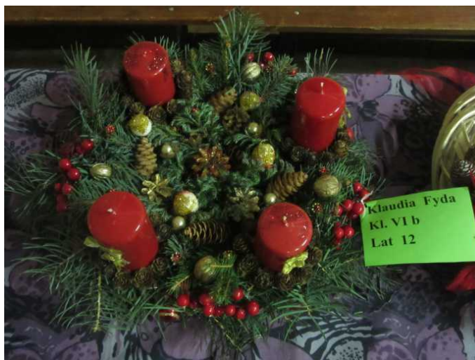
Zwycięski wieniec uczennicy ze szkoły podstawowej- Klaudii Fydy