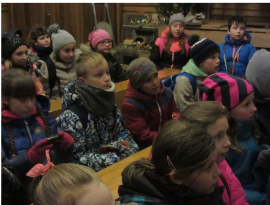
W kaplicy, gdzie obejrzeni my ruchom szopk .