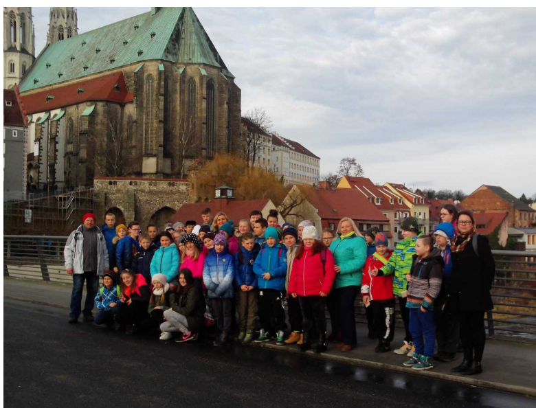
Tury ci z Mysłakowic w Dreźnie.