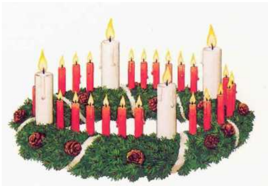
Pierwszy wieniec adwentowy