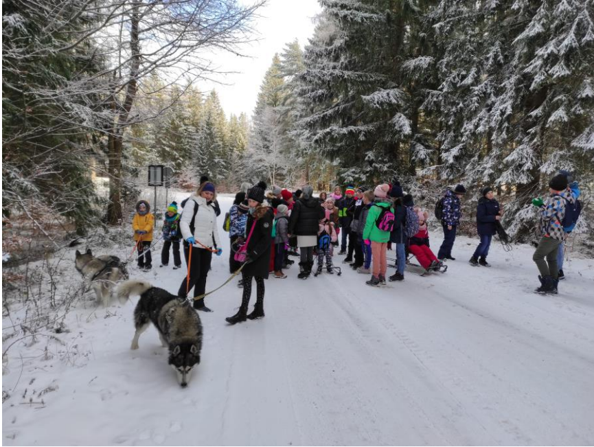
Spacer z psami husky.