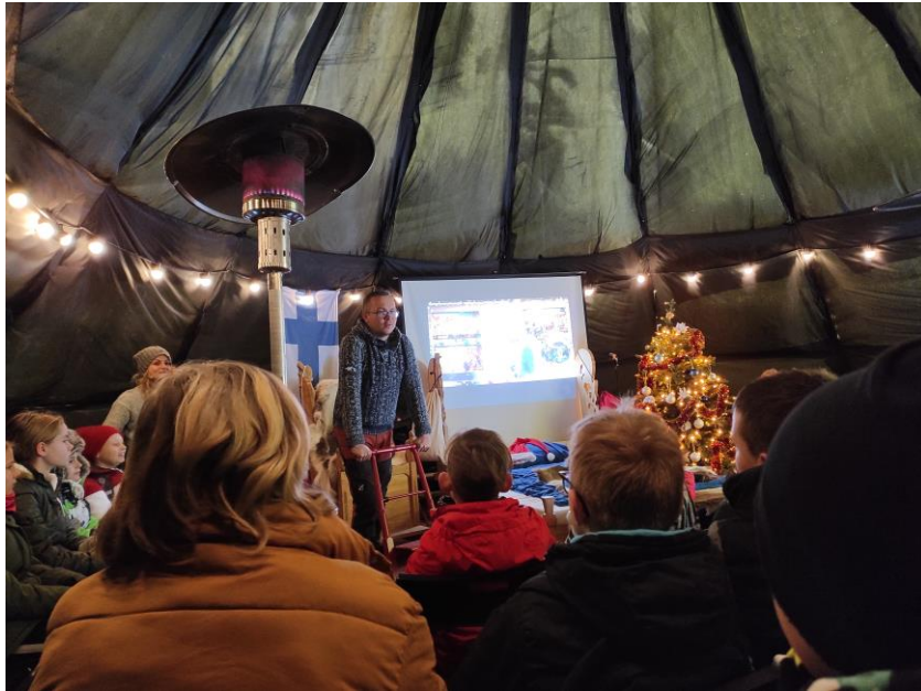
W fińskiej szkole.