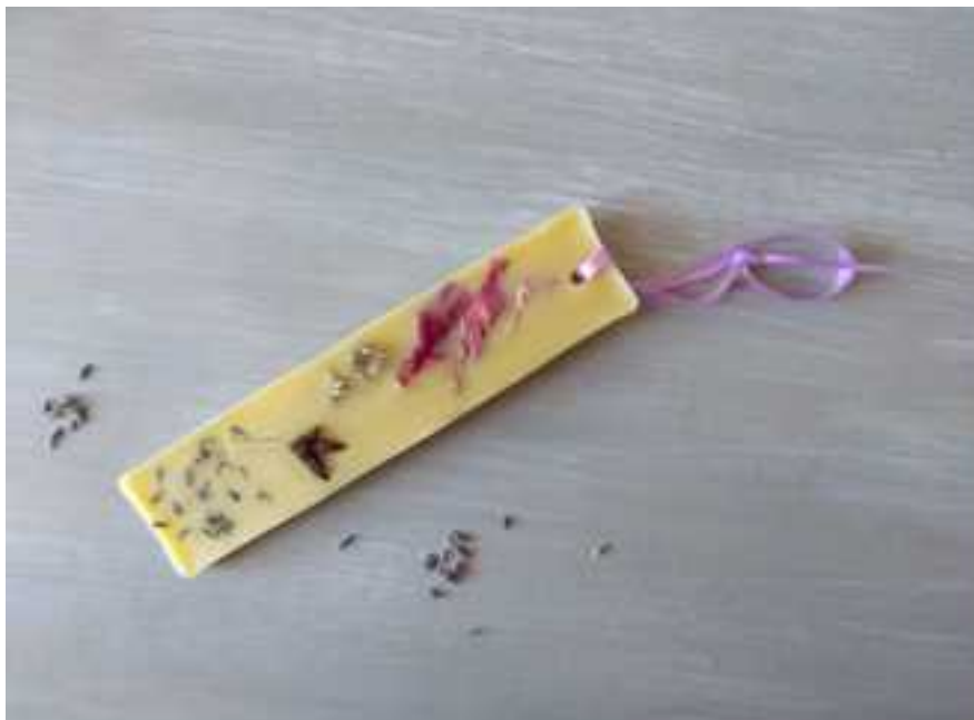
Zawieszka zapachowa