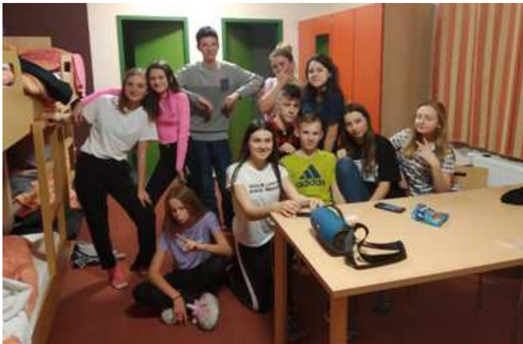
Czas wolny- pora na odpoczynek i integrację.