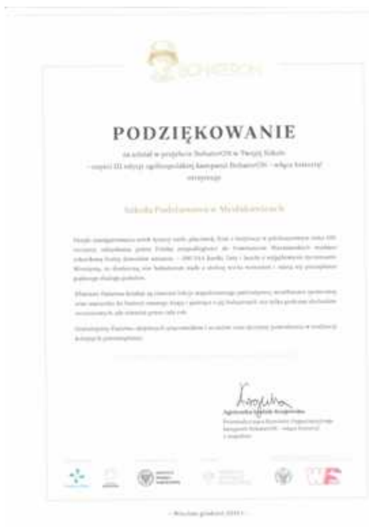
Podziękowanie dla naszej szkoły za udział w projekcie