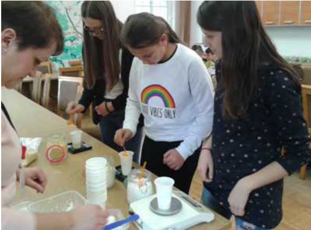
Przygotowanie składników do wykonania zawieszki zapachowej