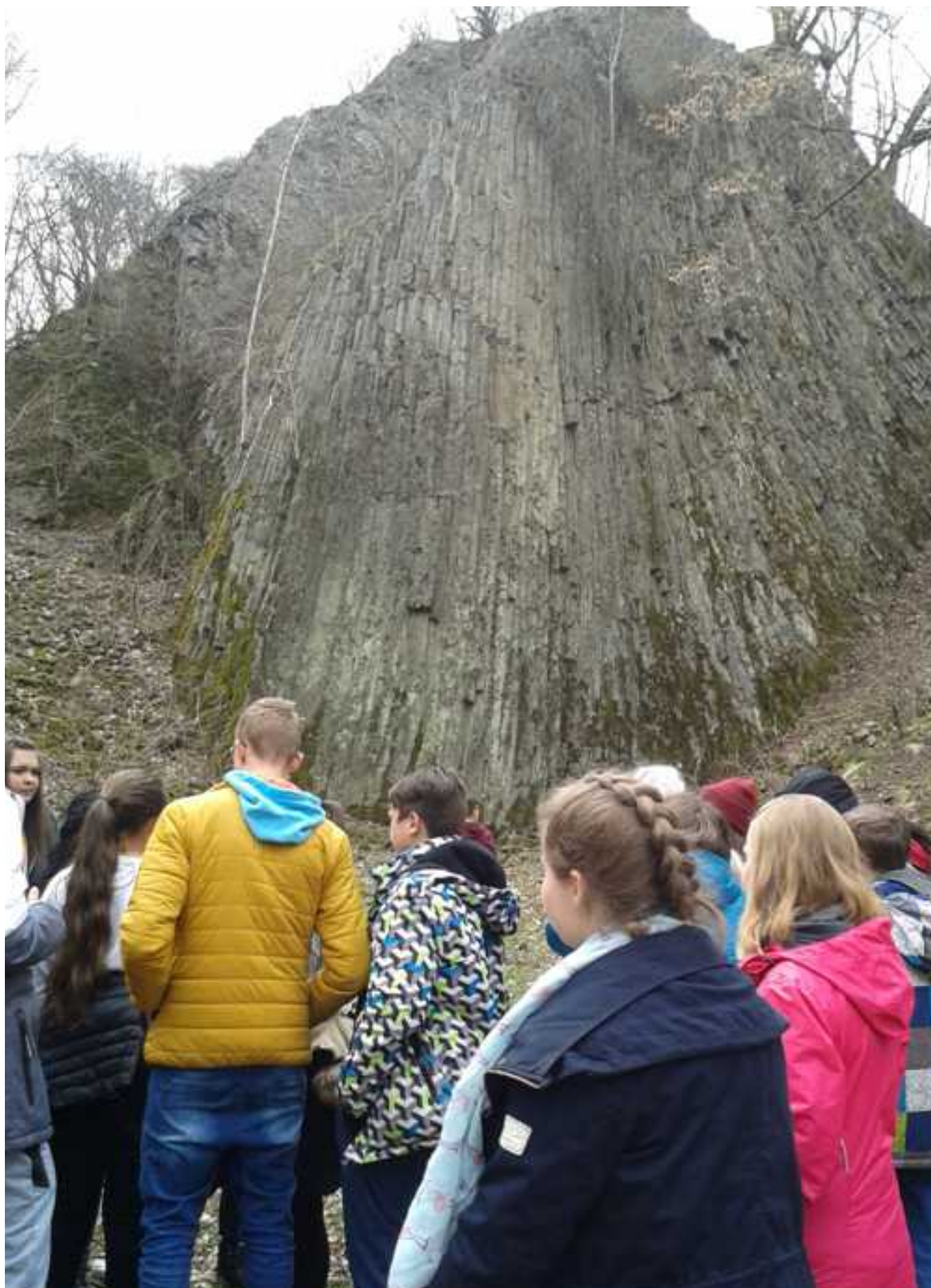
Małe Organy Myśluborskie na wzgórzu Rataj