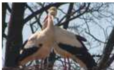
Nasze bociany