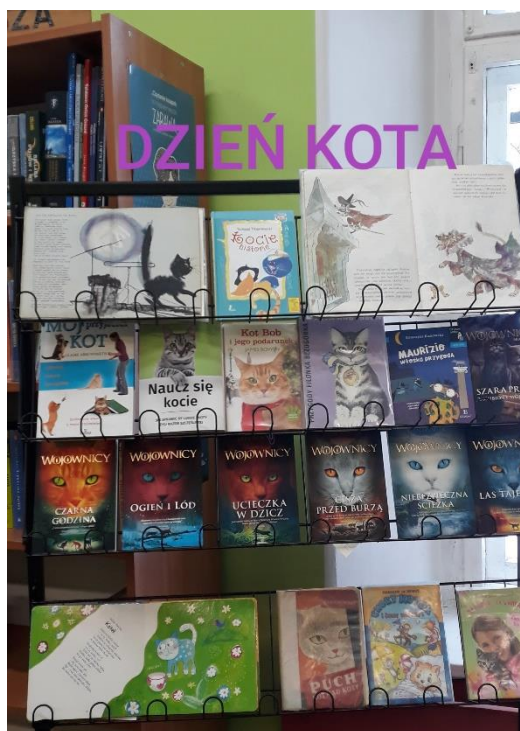
Wystawka książek o kotach.