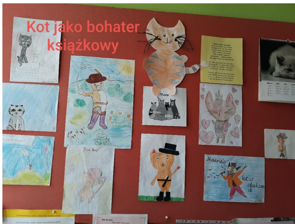
Dzieci przygotowały wyjątkowe prace o kotach.